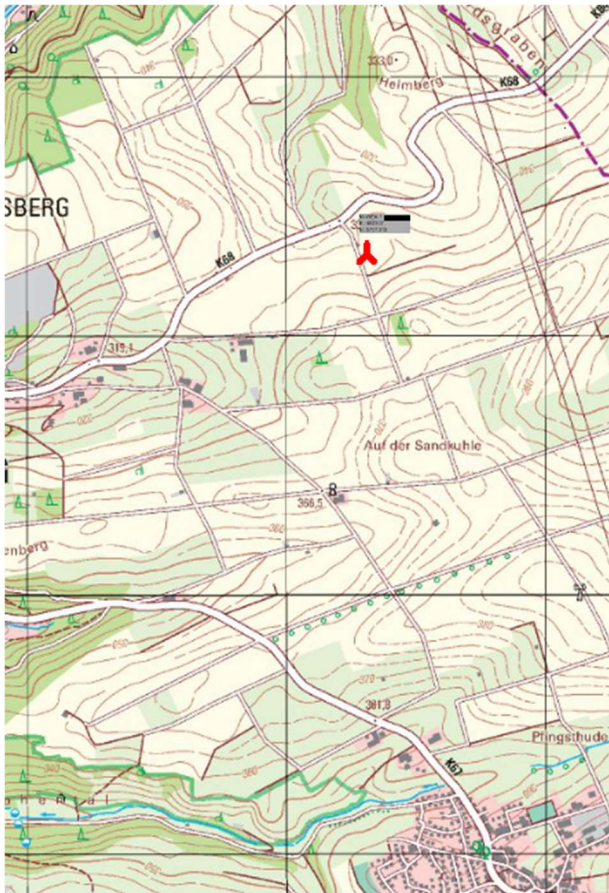
Abb.1: Auszug Übersichtskarte mit Standort M-WEA 1 (Koordinaten: R:32U492.307 H:5.701.315)

Die konkrete Lage und vorgesehene Anordnung der Anlagen mit ihren Zuwegungen sind dem Kapitel 2 zu entnehmen.